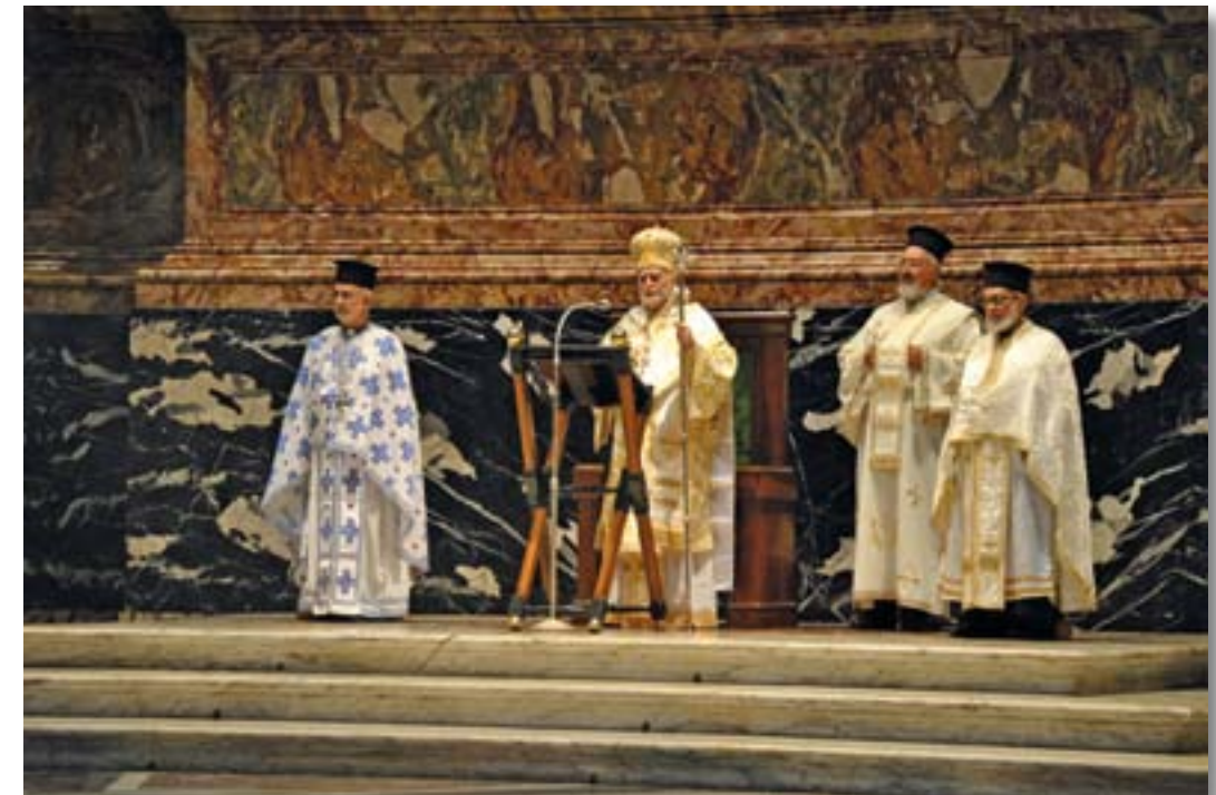
Roma, maggio 2013. Cattedra di San Pietro, Basilica Vaticana.

"Pietro annuncia il Cristo nella Pentecoste, con coraggio, con