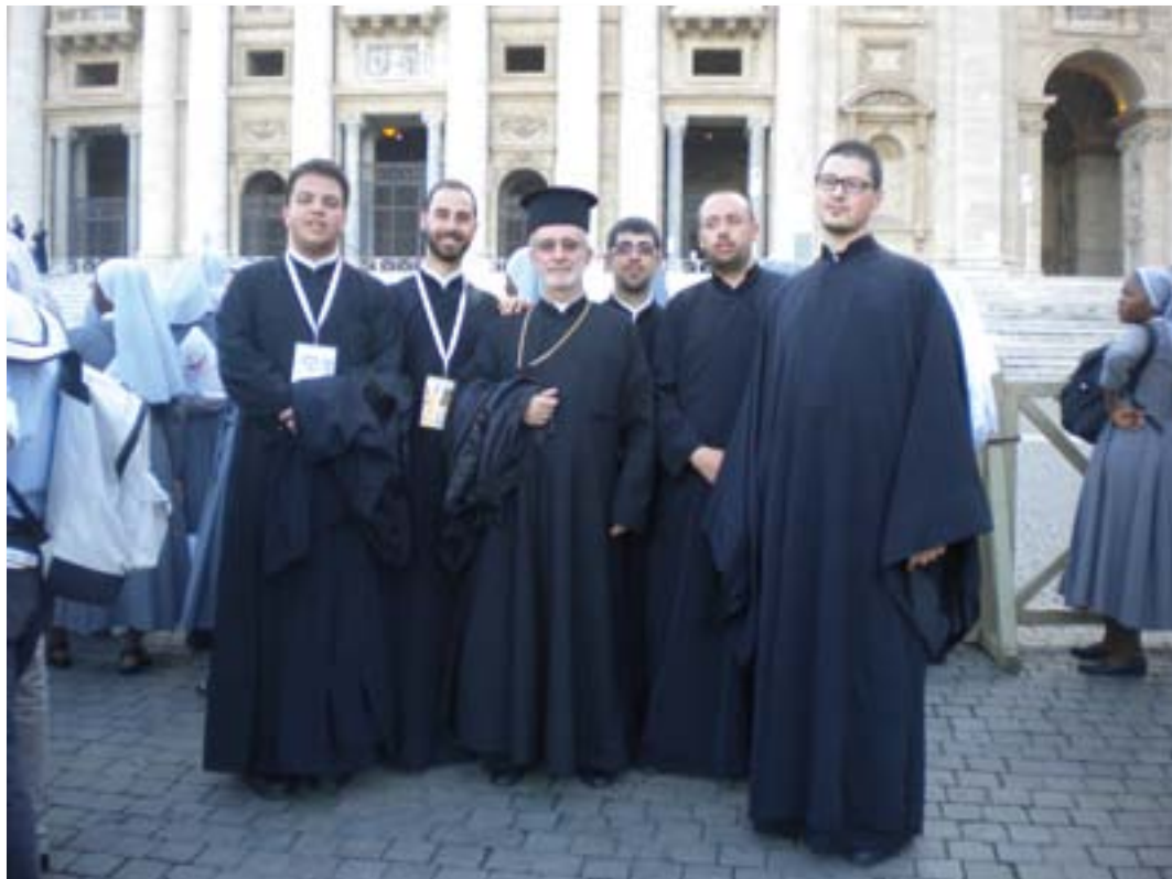
Roma, maggio 2013. I seminaristi con il Rettore del Seminario Maggiore Eparchiale.

occasione del "Pellegrinaggio alla tomba dell'Apostolo Pietro di seminaristi, novizi, novizie e di quanti sono in cammino