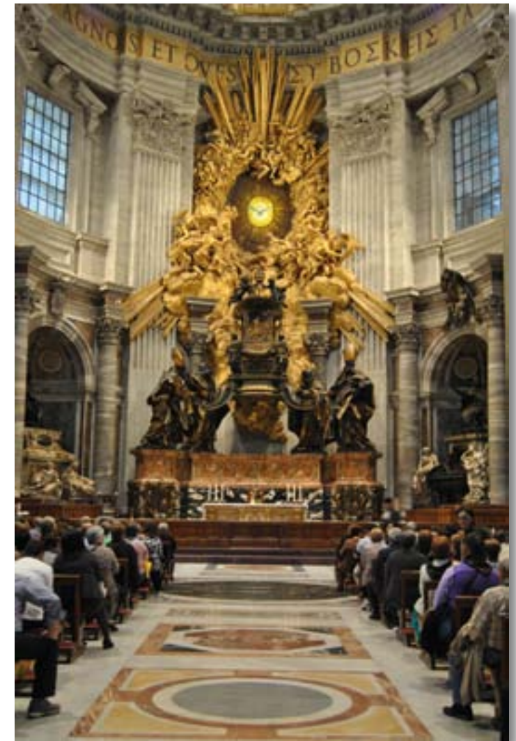
Roma, maggio 2013. Cattedra di San Pietro, Basilica Vaticana.

Per poco, però, perché di nuovo si respira la santità del luogo quando si scende nelle ‘catacombe’ e si sosta in