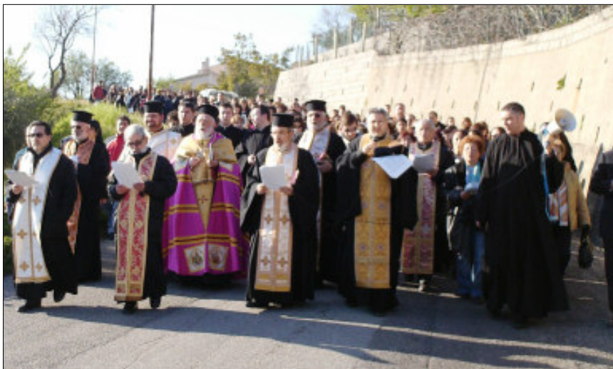
Macchia Albanese. Giornata della Gioventu