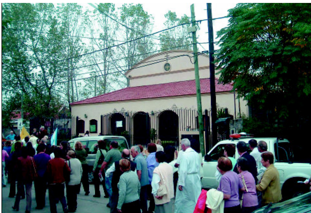
Buenos Aires. Rientro della processione in chiesa