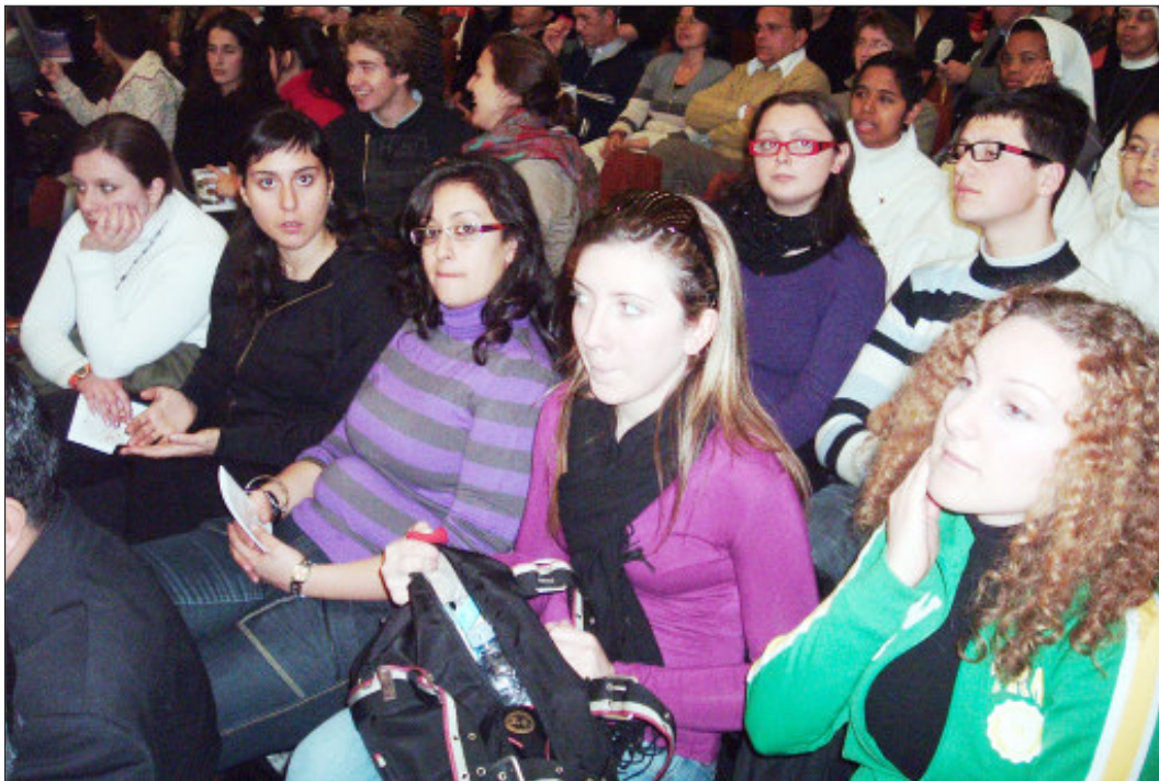
Roma. Alcuni giovani universitari dell'eparchia di Lungro.

pullman è di per sè un incontro. L'amicizia è un varco che molti sono costretti ad aprire in quella specie di muro di Berlino che è la timidezza. Se all'inizio alcuni si “difendevano” con gli auricolari sentendo musica nei vari I-Pod e mp3-players (termini che ai meno giovani sembrano delle formule chimiche), piano piano, conversando si è potuto far conoscenza. Poetici e pragmatici, con la grazia dell'innocenza e insieme la lucidità di chi vuol vedere nel fondo delle cose, capace di scuotere e spiazzare piacevolmente l'interlocutore, i nostri giovani