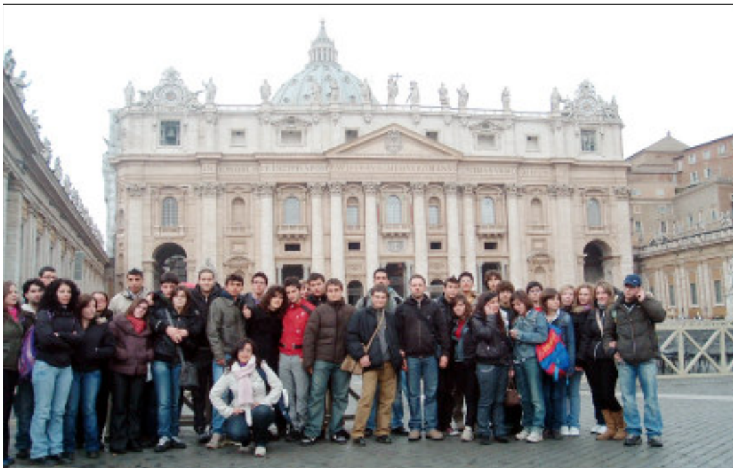
Roma. Il gruppo dei giovani universitari della nostra eparchia.

Mi è capitato, di rispondere al ritorno, durante una sosta in Autogrill all'eterna domanda "allora che fare, che si può fare per migliorare la realtà?". "Innanzitutto bisogna caricarsi con la preghiera e poi provate a entrare in un rapporto di conoscenza col territorio nel