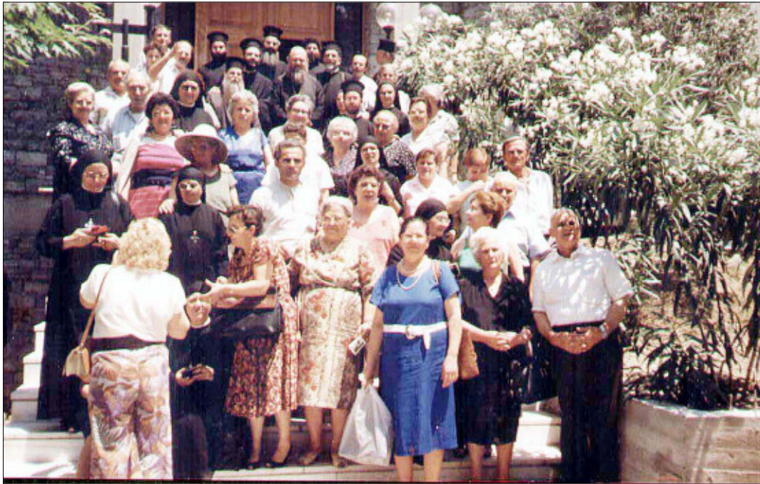
Livadia, 3 luglio 1990. Il gruppo dell'eparchia di Lungro attorno al metropolita Ieronimos dopo il ricevimento in episcopio.

Levadia domenica 3 luglio 1990, in occasione del I pellegrinaggio eparchiale lungrese nell'Ellade (28 giugno-5 luglio 1990).