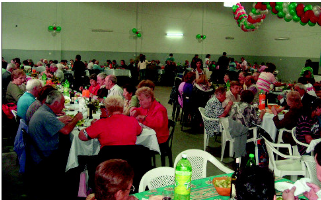
Buenos Aires. Agape fraterna dopo la processione di S. Giorgio