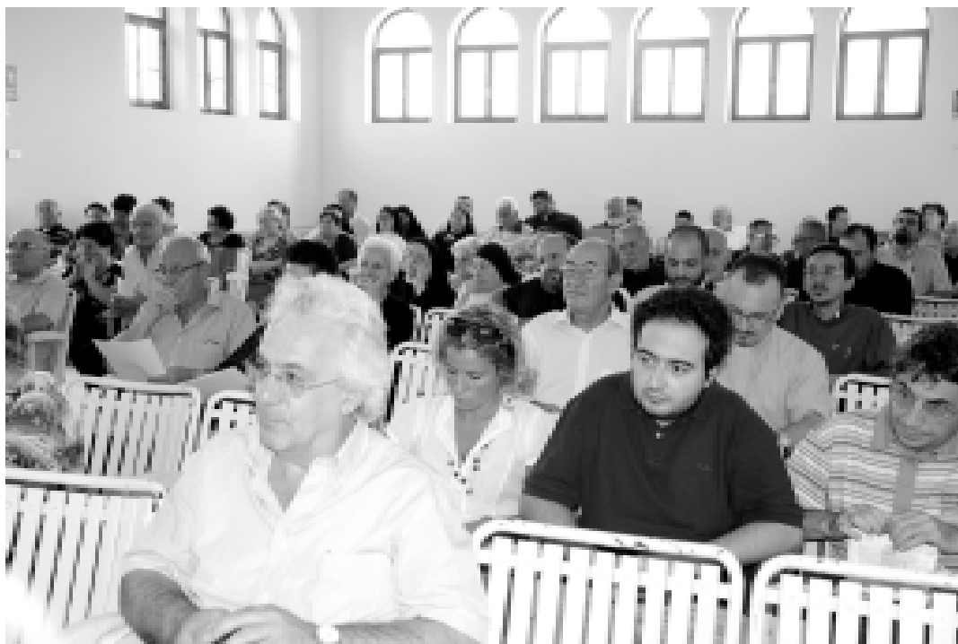
San Cosmo Albanese. XXI Assemblea Diocesana

Il Vescovo, nel suo invito, ha ricordato che un particolare compito spetta agli orientali cattolici, quello di promuovere l'ecumenismo per come richiamato dal Concilio Vaticano II (Decr. OE 24): “Alle Chiese Orientali avente comunione con la Sede Apostolica romana, compete lo speciale ufficio di promuove-