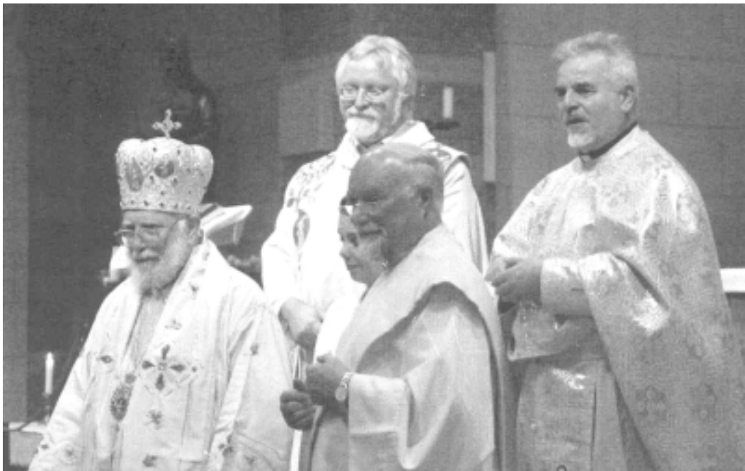
Germania. Celebrazione liturgica

concelebrazione eucaristica nella bella e antica chiesa-santuario dei PP.Francescani. Poi, nel salone messo a disposizione dai religiosi, si è svolto il simpatico intrattenimento, preparato dagli emigrati e prolungatosi fino a tarda ora. Al momento del brindisi, che ha concluso la festosa serata, il P.Missionario a nome dei partecipanti ha salutato e ringraziato l'ospite e ha fatto un resoconto dell'attività dei missionari italiani; ha raccontato le proprie esperienze di vita e quelle degli emigrati, il difficile esordio negli anni del dopoguerra, i problemi legati alla ricerca del lavoro e l'impegno dei missionari per favorire la vita religiosa della comunità italiana. Nella risposta al saluto del missionario e di altri intervenuti, Mons. Lupinacci ha ringraziato tutti i presenti per la partecipazione, per l'attaccamento che dimostrano verso la nostra terra e a tutti ha augurato ogni bene.