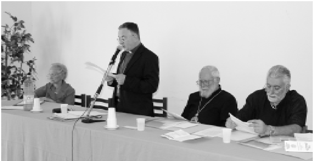
San Cosmo Albanese. Agosto 2008. Tavolo di presidenza

L'arco di tempo tra l'XI ed il XIV secolo determina in Calabria ed in genere nel Meridione d'Italia una trasformazione radicale, che fece rischiare il crollo dei precedenti equilibri. In questo periodo, nel 1054, si consuma la definitiva rottura tra Oriente e Occidente ed è in questo periodo che con la conquista normanna si attiva il processo di latinizzazione del rito e della cultura, che porta all'insanabile rottura con l'Oriente, con ripercussioni negative sullo stesso monachesimo