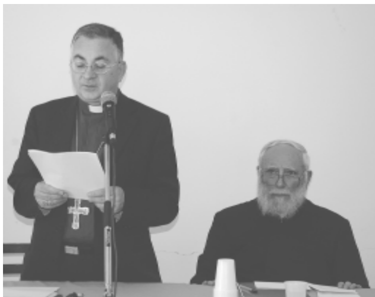
S.E. Mons. Luigi Renzo, Vescovo di Mileto-Nicotera-Tropea

sto dello storcere il naso al possibilismo. Soprattutto nel rapporto con gli Ortodossi di Grecia la diffidenza è ricorrente.