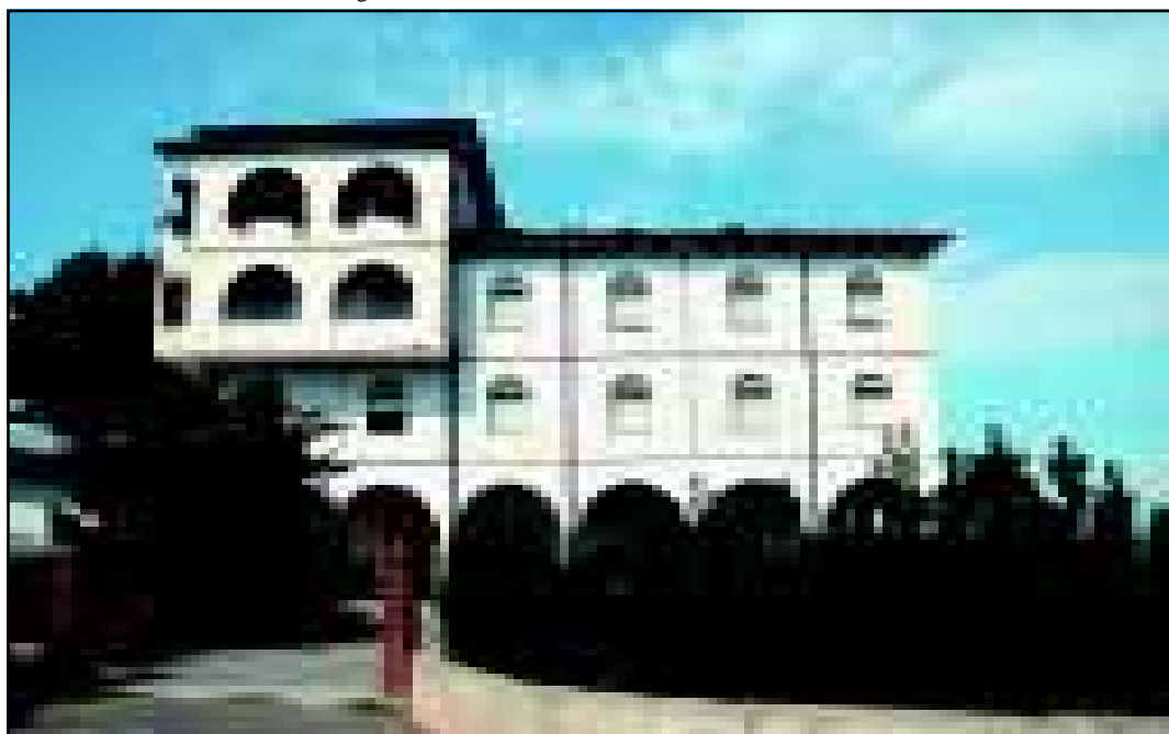
San Cosmo Albanese. Casa del Pellegrino