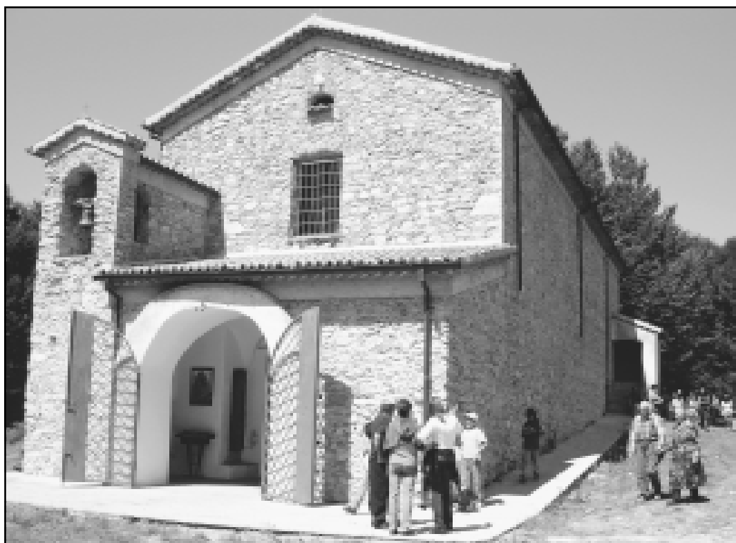
Acquaformosa. Santuario Madonna del Monte.