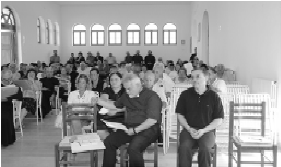
San Cosmo Albanese. XXI Assemblea Diocesana

comunista; la fratellanza e la comunione concreta che si è sempre vissuta e si vive tra i fedeli della Chiesa cattolica bizantina e quella ortodossa in Romania, ma anche il contrasto di vertice delle due Chiese che ha fatto arretrare il dialogo ecumenico, di recente e con presa di posizione forte del Santo Sinodo della Chiesa ortodossa romena.