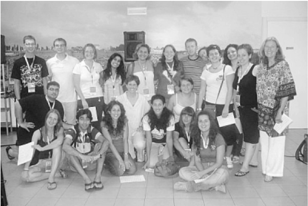
Loreto. Agorà dei giovani. 2008

mana ci ha cambiati. Noi viviamo in una società spesso insoddisfatta e scontenta, persa dietro a facezie varie e poco attenta alle realtà importanti della vita; risulta, perciò, molto facile distrarsi e dimenticare che la cosa più importante è proprio la vita stessa, la possibilità di viverla e di trascorrerla tranquillamente in un contesto di pace. Durante questa settimana mi sono trovata di fronte ai racconti dei ragazzi palestinesi, israeliani, libanesi, turchi le cui parole non erano apertamente strazianti e cruenti, ma che comunque sono riuscite a riempire il mio cuore di una tristezza indicibile. La loro sofferenza ed il loro dolore non è manifesto, è custodito nel cuore insieme però all'amore per Dio; è per questo che la mia malinconia, grazie a loro entusiasmo e alla loro fede,