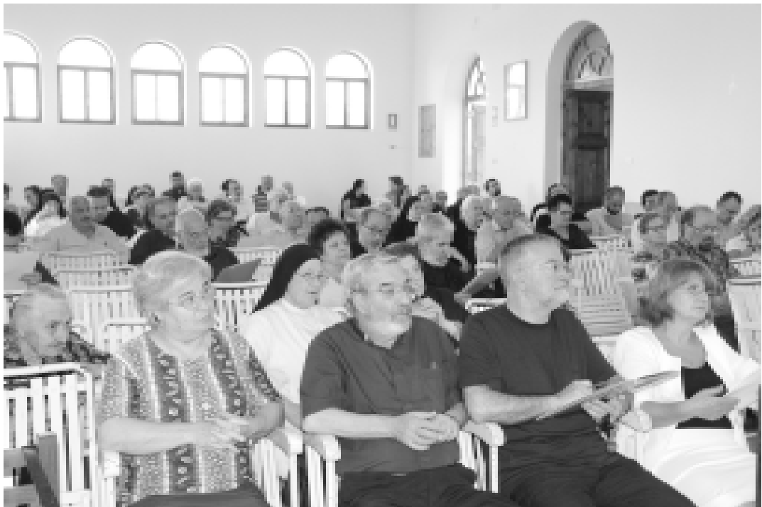
San Cosmo Albanese. XXI Assemblea Diocesana

Preghiamo la Beata Vergine Maria, Madre della Chiesa, che viene venerata particolarmente a Màriapòcs, di appoggiare con il suo amore la vita della Chiesa cattolica in Europa, di intercedere per i nostri vescovi, affinché possano diventare buoni pastori secondo l'esempio di Cristo. Santa Maria, prega per l'unità dei cristiani affinché tutti siano un secondo la volontà del tuo Figlio. Amen