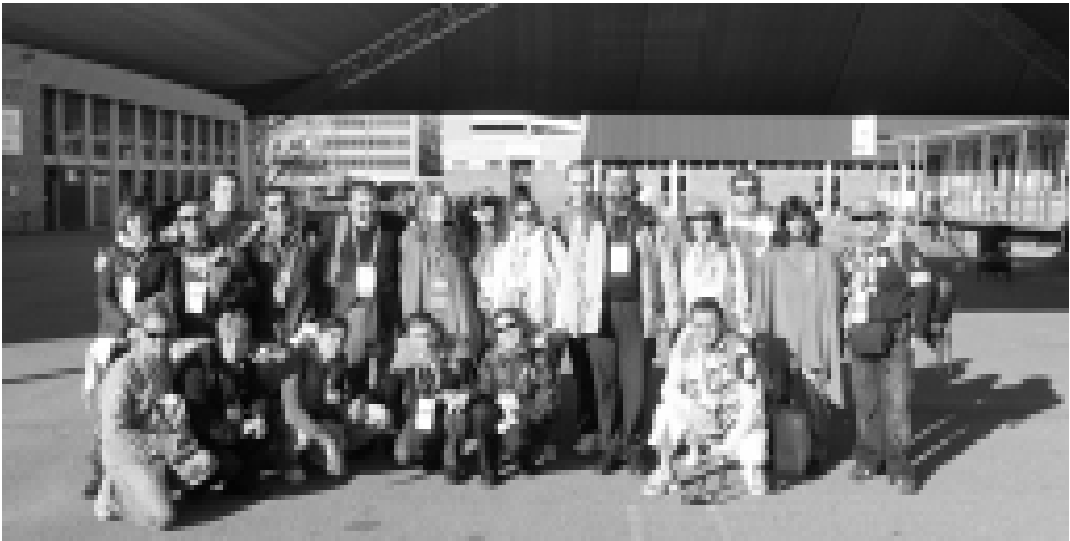
Il gruppo della Pastorale Giovanile Calabria a Sydney

ne dei colori che ha invaso la città. Ho scoperto che, al di là dei contenuti forti di questa GMG - desunti dai discorsi del Papa - le giornate si trascorrono con grande semplicità e tanta amicizia. E' quasi una liturgia dell'amicizia vedere vari giovani parlarsi, scambiarsi gadget tra di loro, abbracciarsi (ho notato alcuni dietro un cartone con la scritta free hug / abbraccio gratuito). Ciò che ci impedisce di vivere ogni istante della giornata è la presunzione di conoscere già la vita e la bellezza della fede tanto che non ne valga neppure la pena di viverla o coltivare la propria interiorità. I grandi raduni che abbiamo fatto, hanno lasciato i nostri ragazzi contenti. Quando si assiste a queste preghiere di massa, ci si commuove, non solo perché "se due o tre si riuniscono per invocare il mio nome, io sono in mezzo a loro" (Mt.18,18-20) ma anche perché si entra in contatto con una dimensione umana in cui meravigliosamente si torna ad essere uniti. Vagare nell'infinito della preghiera, senza il peso del corpo e del