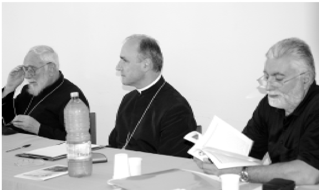
San Cosmo Albanese. XXI Assemblée Diocesana

37 FORTINO, E., La penitenza nella Chiesa Bizantina , pp. 22-23.