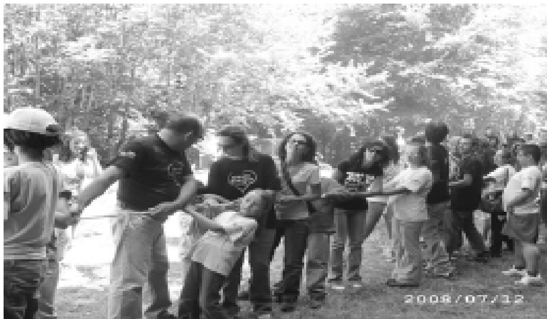
Estate ragazzi 2008

Un traguardo non facile, ma con l'aiuto di Dio, certamente possibile.