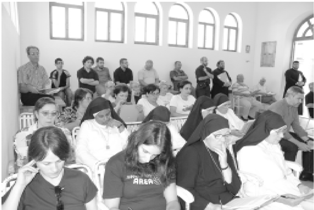
San Cosmo Albanese. XXI Assemblea Diocesana

. La nostra specificità di Chiesa cattolica di rito bizantino ci spinge ad una maggiore vicinanza e facilità al dialogo verso le Chiese ortodosse, rispetto a quelle della Riforma, pure avvicinate soprattutto a livello regionale.